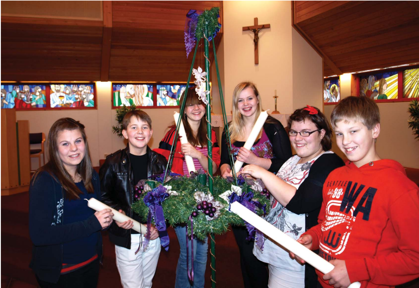
Aðventan undirbúin í kirkjunni okkar

Takið eftir aðventudagskrá Seljakirkju í miðopnu