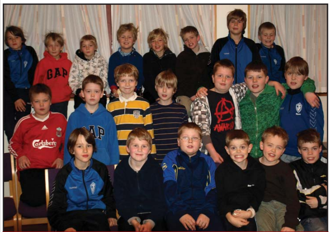
Hressir KFUM strákar í Seljakirkju

Guðsþjónustur grunnskólanna og leikskólanna eru ánægjulegir fastir liðir í adventudagskrá Seljakirkju. Það er allt vel undirbúið af nemendum og starfslíði í samráði við starfsfólk kirkjunnar. Foreldrar og aðrir sem njóta vilja góðra stunda eru þar auðfúsugestir. Guðsþjónustur grunnskóla og leikskóla verða þessar: Þriðjudaginn 15. desember eru guðsþjónustur fyrir Ölduselsskólann. Kl. 8:50 eru 3. og 4. bekkur, kl. 10, 1. og 2. bekkur og kl. 11:20, 5., 6. og 7. bekkur. Miðvikudaginn 16. desember eru guðsþjónustur Seljaskólans, kl. 9 fyrir 1. og 2. bekk, kl. 10:30, 4. og 6. bekk og kl. 12:45, 3. og 5. bekk. Fimmtudaginn 17. desember kl. 9:30 og kl. 10:45 eru guðsþjónustur leikskólanna. Guðsþjónustur unglíngadeilda Seljaskólans og 7. bekk eru föstudag 18. desember kl. 10 og fyrir unglíngadeildir Ölduselsskóla kl. 11.